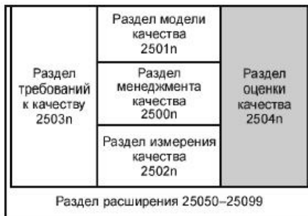
Рисунок 1 - Организация SQuaRe серии международных стандартов