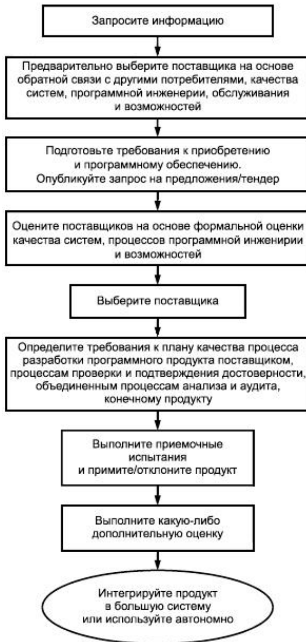
Рисунок 4 - Пример процесса оценки/приобретения или модификации заказной программной продукции