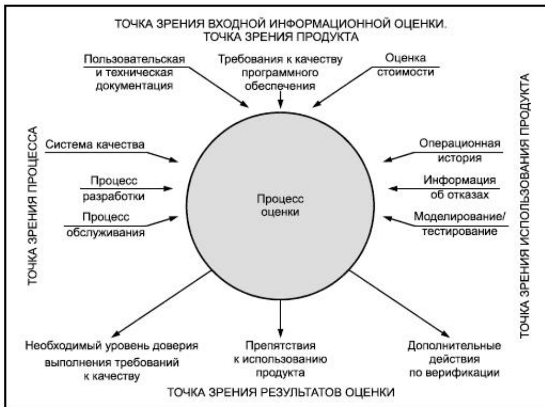
Рисунок 5 - Процесс оценки качества продукции с точки зрения приобретателя

На этом рисунке показано, что оценка продукции может учесть информацию с других точек зрения, таких как точка зрения продукции, процесса и использования продукции, в результате чего формируется точка зрения результатов оценки.