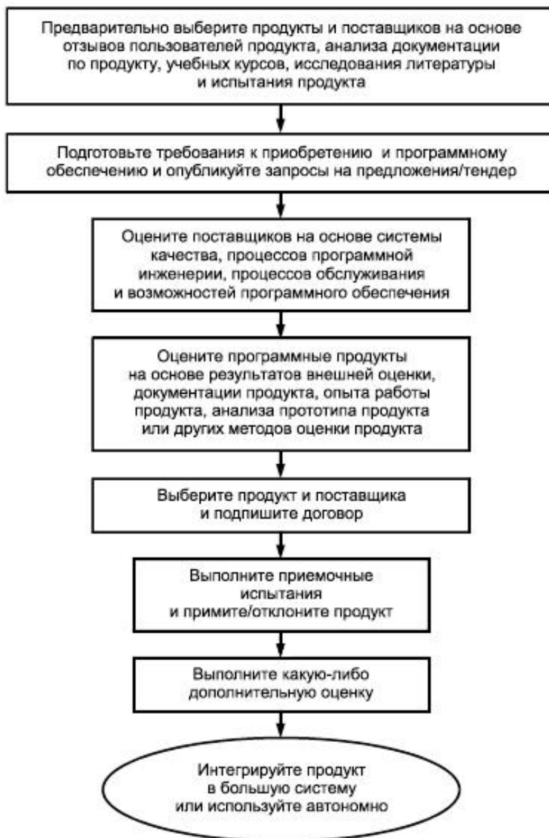
Рисунок 3 - Пример процесса оценки/приобретения готовой продукции