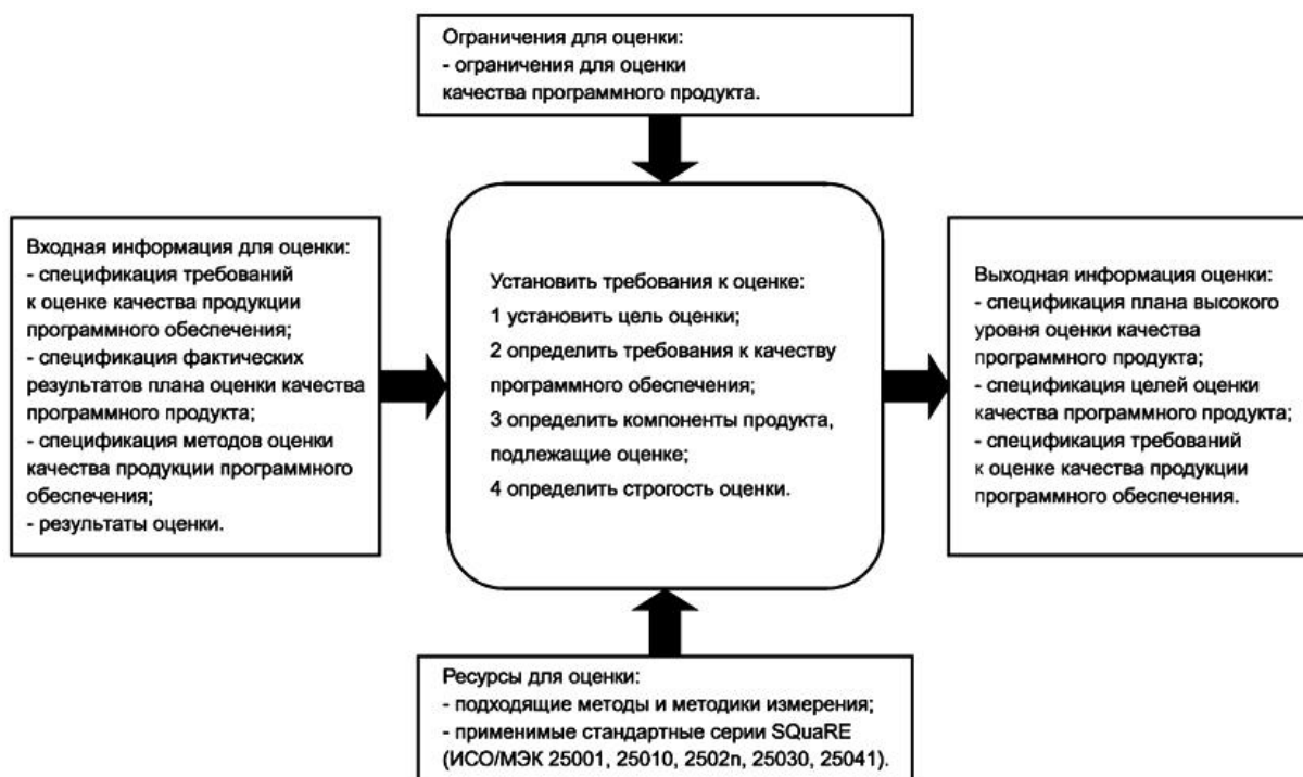
Рисунок F.1 - Определение требований к оценке в процессе оценки качества программного продукта