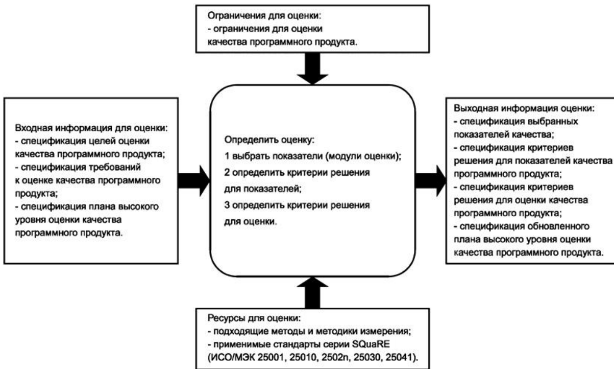
Рисунок F.2 - Определение оценки в процессе оценки качества программного продукта