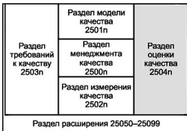
Рисунок 1 - Организация SQuaRe серии международных стандартов