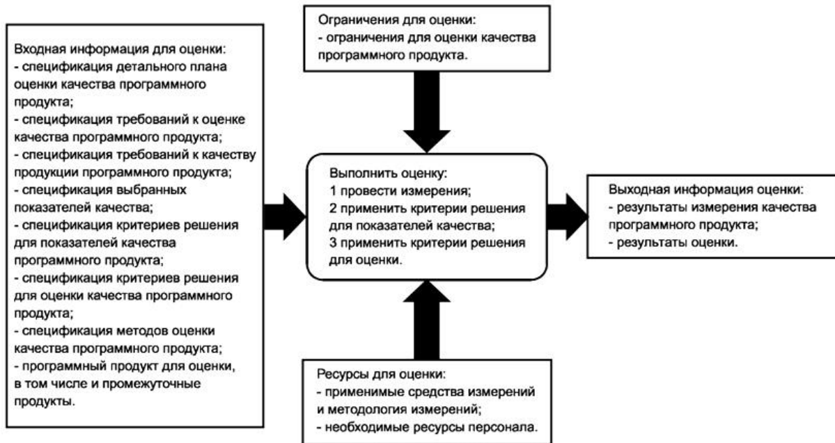
Рисунок F.4 - Выполнение оценки в процессе оценки качества программного продукта