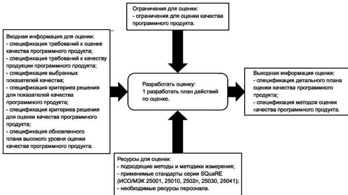
Рисунок F.3 - Разработка оценки в процессе оценки качества программного продукта