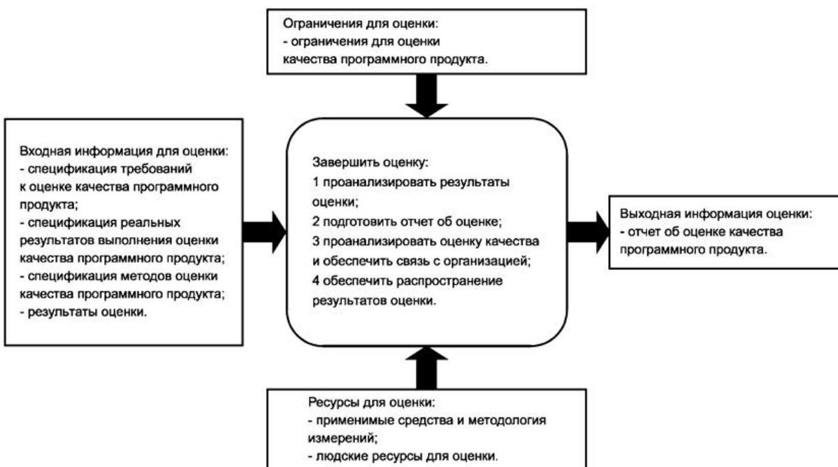
Рисунок F.5 - Завершение оценки в процессе оценки качества программного продукта